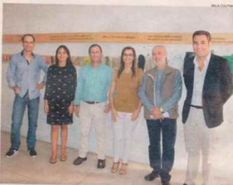
Os investigadores do Marefoz que colaboraram na organização da exposição em Buarcos

Núcleo do Mar O que é o lixo marinho, de onde vem e o perigo que representa para todo o ecossistema. Um alerta ambiental na exposição patente em Buarcos